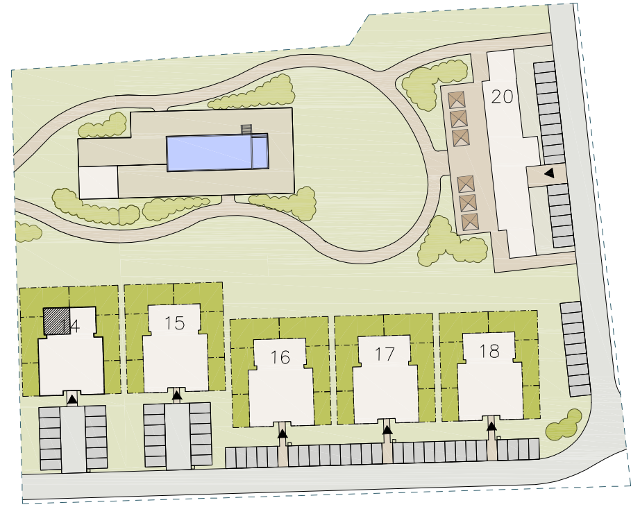
PLAN SYTUACYJNY – ETAP I